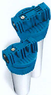
Contenitore per cartucce serie FP3 standard testa inserto ottone vaso opaco bianco FP3 filter cartridge housing with brass insert and opaque white sump

*Alloggia cartucce speciali foro 32mm/Special cartridges housing hole 32mm.