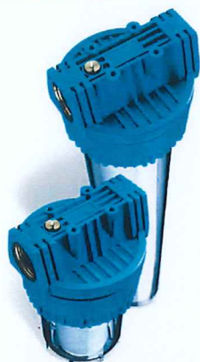
Contenitori per cartucce serie FP3 standard testa inserto ottone vaso san trasparente FP3 filter cartridge housing with brass insert and transparent sump